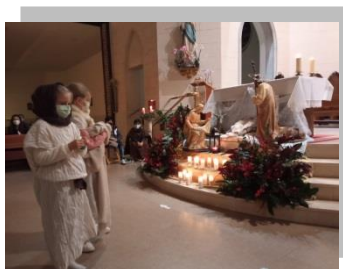
Celebración con los niños de la catequesis

La catequesis de niños concluyó el trimestre con una bonita celebración prenavideña en el templo que terminó en el jardín de la parroquia con la bendición y encendido del árbol. Los chicos de postcomunión hicieron una gincana con motivo navideño por el Parroquial hizo un reparto especial la cena de Navidad a las familias que grupo Bokatas sustituyó su navideña con las acompañan por el cestas navideñas que incluían un forro polar donados por un feligrés.