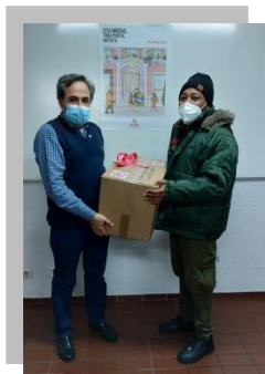
Entrega de alimentos para la cena de Navidad