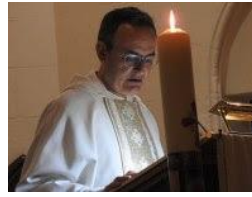
Lectura del Evangelio de Resurrección el Sábado Santo.

está celebrando la Santa que hemos todos los fieles. En la bautizamos a dos harán su primera deseamos a todos