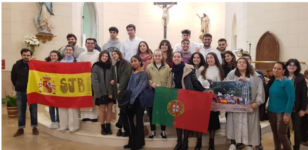
Jóvenes de ambas parroquias se fotografían juntos al terminar la Misa de 12.00h